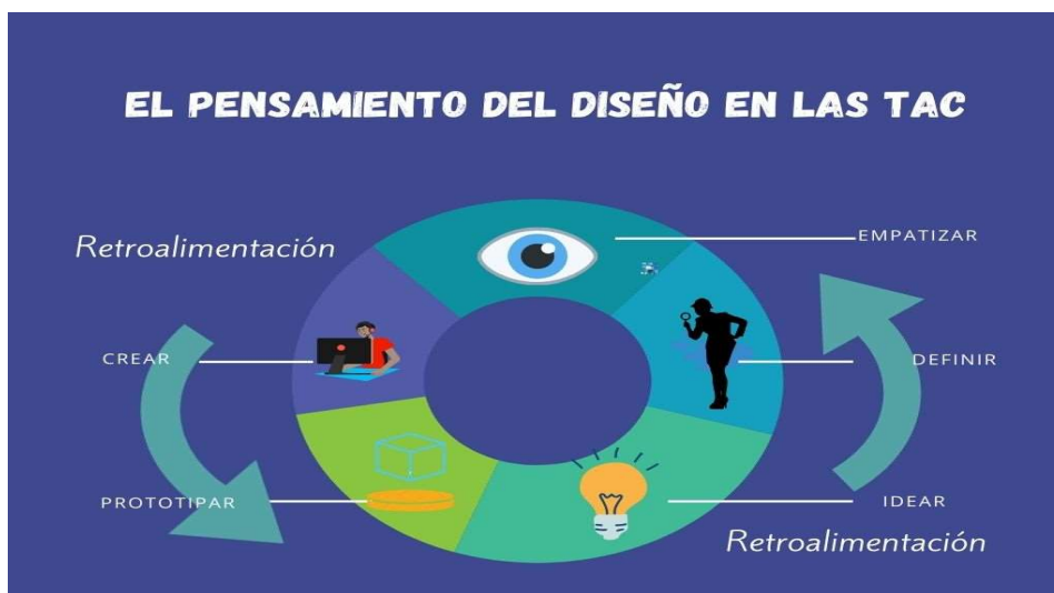
Figura 1 (El Pensamiento del Diseño en las TAC)