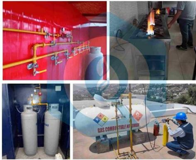
Figura 14: Sistema industrial de Gas Centralizado de GLP.

Nota: qualynortperu/2023/sistemas centralizados de glp