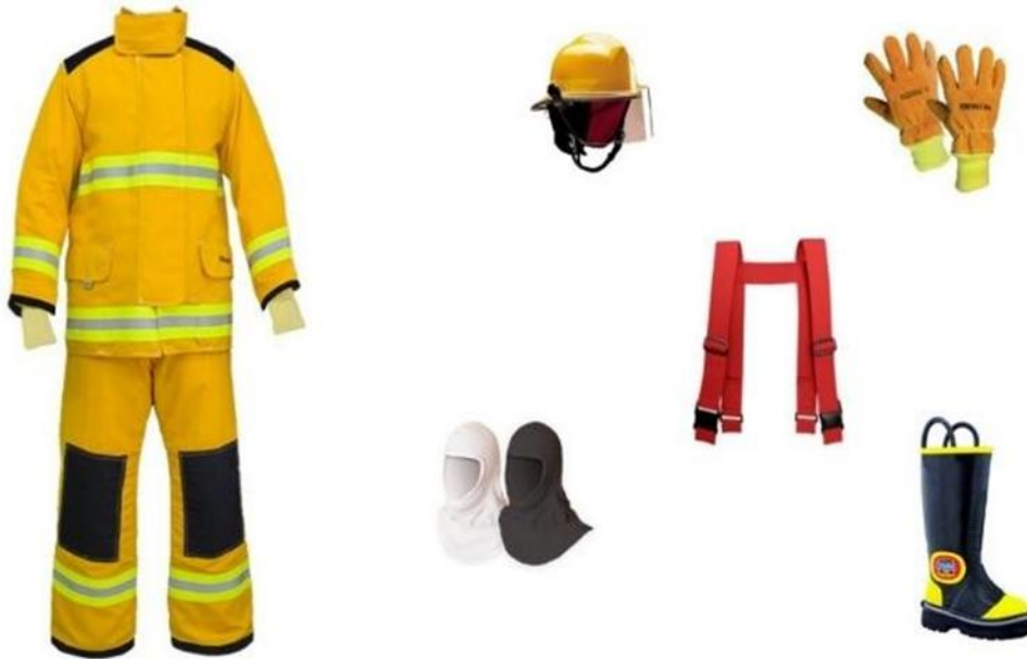
Figura 11: Equipo de Protección Personal para bomberos

Nota: AmigoSafety/08-08-2022/Equipo Completo para Bombero RomakBOM-1001-13