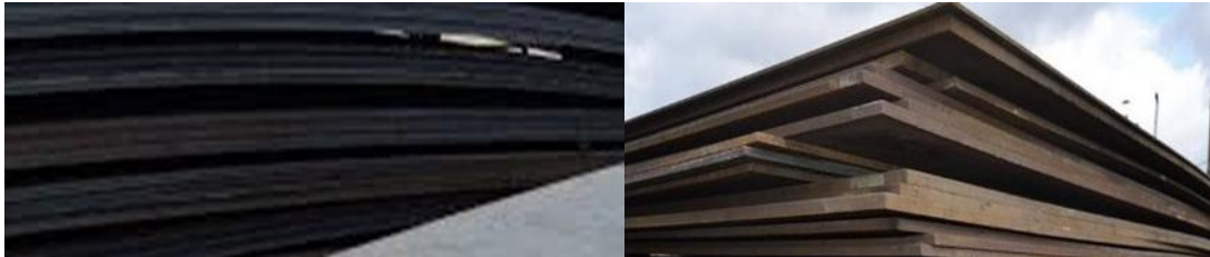
Figura 5.: Láminas de acero A36 resistente a temperaturas elevadas

Nota: Cia. General de Aceros S.A/ 10-2024/ laminas-a36