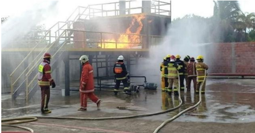
Figura 4: Curso de Instructor de Fuego Vivo que corresponde a la normativa NFPA 1403

Nota: natursonne/agosto del 2019/simulador de fuego real