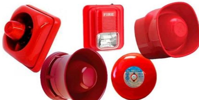
Figura 10: Alarmas para alerta de Incendios

Nota: Extintores B.S. Siglo XXI S.L./ 2025/sirenas para alertar de incendios.