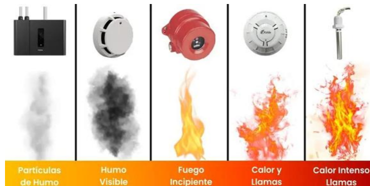
Figura 7: Detectores humo y sensores de temperatura

Nota: Grup Carol/ 19 julio, 2022/cámaras térmicas