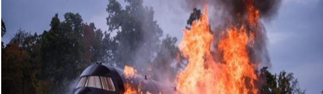
Figura 1: Simulador de fuego real para Bomberos Aeronáuticos

Nota: Airport Fire Training Center Getting a Facelift/February 26, 2024/simulado con fuego real.