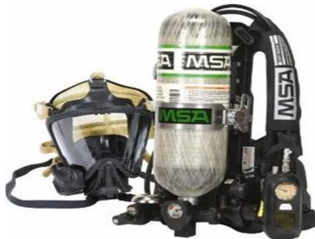
Figura 12: Equipo de Respiración Autónomo Completo (ERA)

Nota: Mundo Dotaciones S.A.S/2025/ Equipo de Respiración Autónomo Completo.