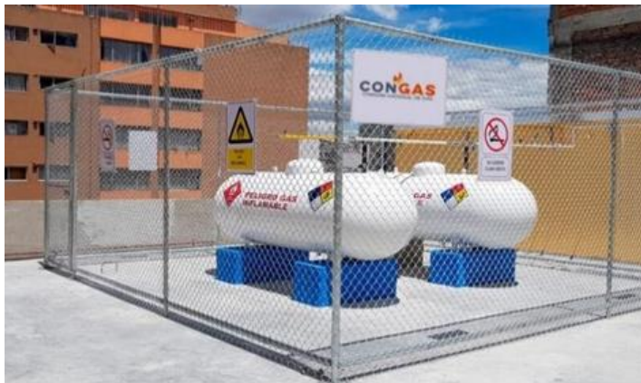
Figura 2: Sistema Centralizado de GLP

Nota: Congas / 2025 /GLP a granel – congas