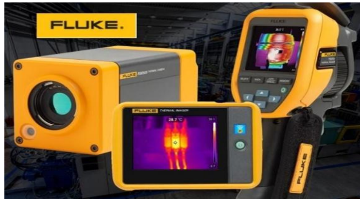
Figura 6: Camara Termica

Nota: Grup Carol/ 19 julio, 2022/cámaras térmicas