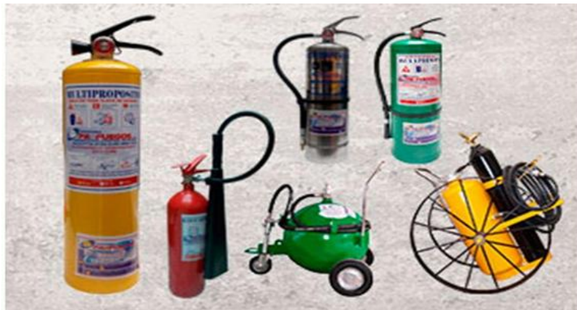
Figura 9: Extintores portátiles para extinción de incendios

Nota: Gold Extin/2024/Extintor de Incendios Multipropósito