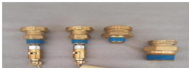
Figura 15: Válvulas de GLP para sistema Centralizados

La operatividad a largo plazo del simulador está sujeta a un estricto plan de mantenimiento preventivo y correctivo. Según Martínez y Ríos (2021), la revisión mensual de los componentes clave, como válvulas, quemadores y sistemas eléctricos, es fundamental para asegurar la fiabilidad y la seguridad del equipo.